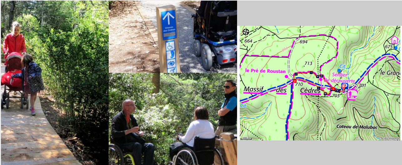
Chemin des cèdres, accessible à tous...